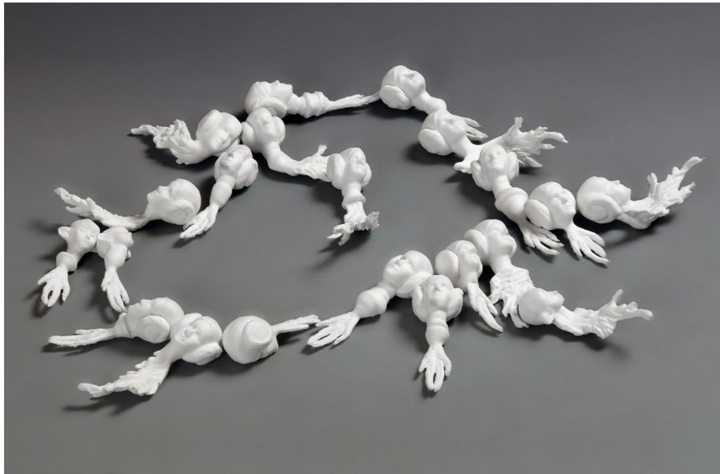
CI-DESSUS Irene Nordli Superwhiteseries 5 porcelaine, 2011 h. 3 cm